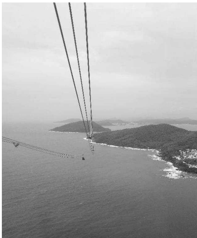
Вид из кабинки фуникулера. Канатная дорога, о. Фукуок.

Фукуок славится плантациями черного перца. На протяжении уже практически двух десятилетий Вьетнам -