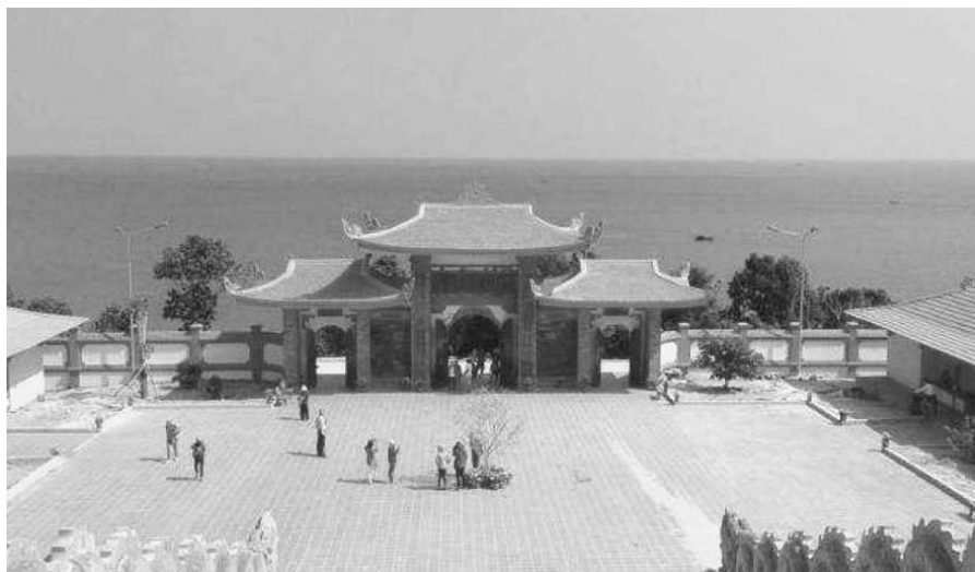
Пагода Хо Куок (Ho Quoc) на восточном побережье острова.

Именно к колониальному прошлому Вьетнама и его тяжкому наследию (две индокитайских войны 1946-1954 и 1957-1975 гг.) отсылает одна из самых известных достопримечательностей о. Фукуок - «Кокосовая тюрьма» (ее узники работали на кокосовых плантациях, расположенных неподалеку). Построенная в конце 40-х гг. XX в., она служила по прямому назначению вплоть до окончания Вьетнамской войны в середине 1970-х гг. В 1995 г. тюрьма, к тому времени закрытая уже более 20 лет, была признана памятником исторического наследия Вьетнамской войны и преобразована в общедоступный музей под открытым небом.