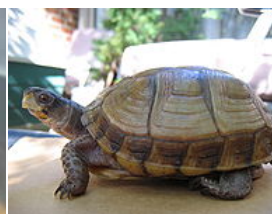
Трехпалая коробчатая черепаха

В Палате представителей Конгресса США от восьми округов штата заседают шесть республиканцев и два демократа