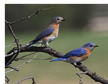
Восточная лазурная птица