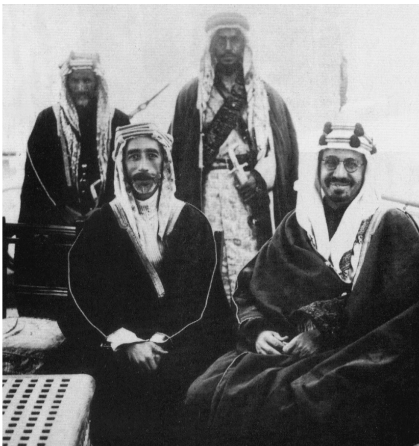
Встреча короля Абдель Азиза (справа) и иракского короля Фейсала I.

Хусейном. Ихваны и улемы требовали военных действий против Хусейна, но прагматик Абдель Азиз выжидал, зная, что все не так просто. Рядом с ним находилась английская миссия во главе с Филби, которая требовала, чтобы он оставался верным договору с Англией и не нападал на английских союзников, а Хусейн был союзником Англии.