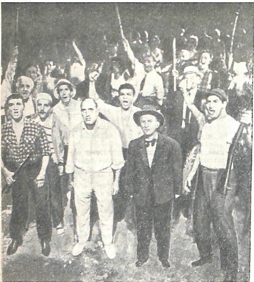
Голпа разъяренных расистов вторглась в африканские кварталы города. Первого попавшегося на их пути негра они решили линчевать «по-особенному». Его привязали к задней оси джипа. Сейчас автомобиль даст полный ход...