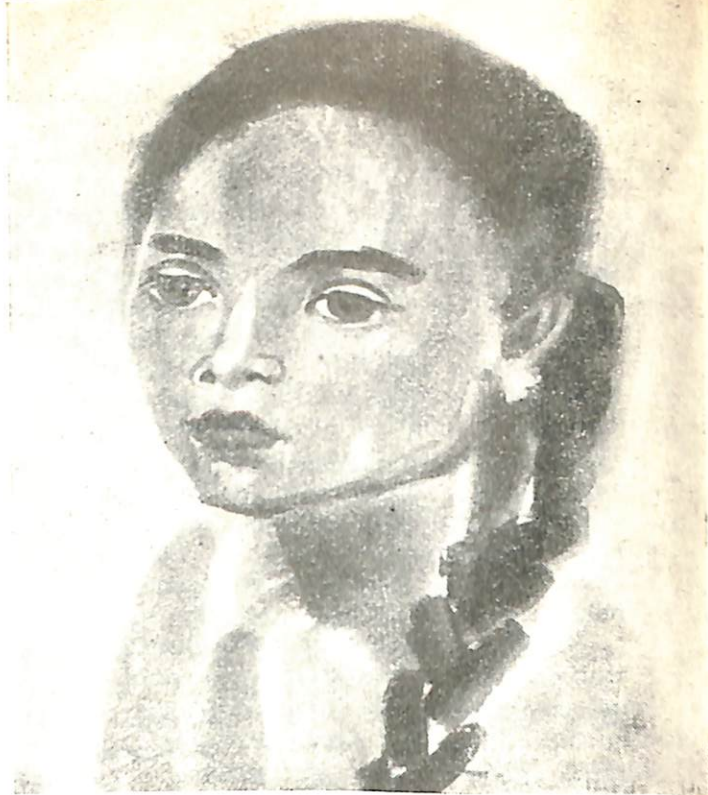
Дочь острова Бали.