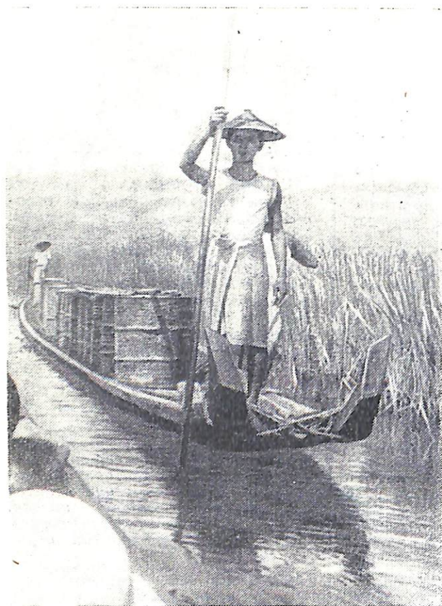
Навстречу восходящему солнцу.