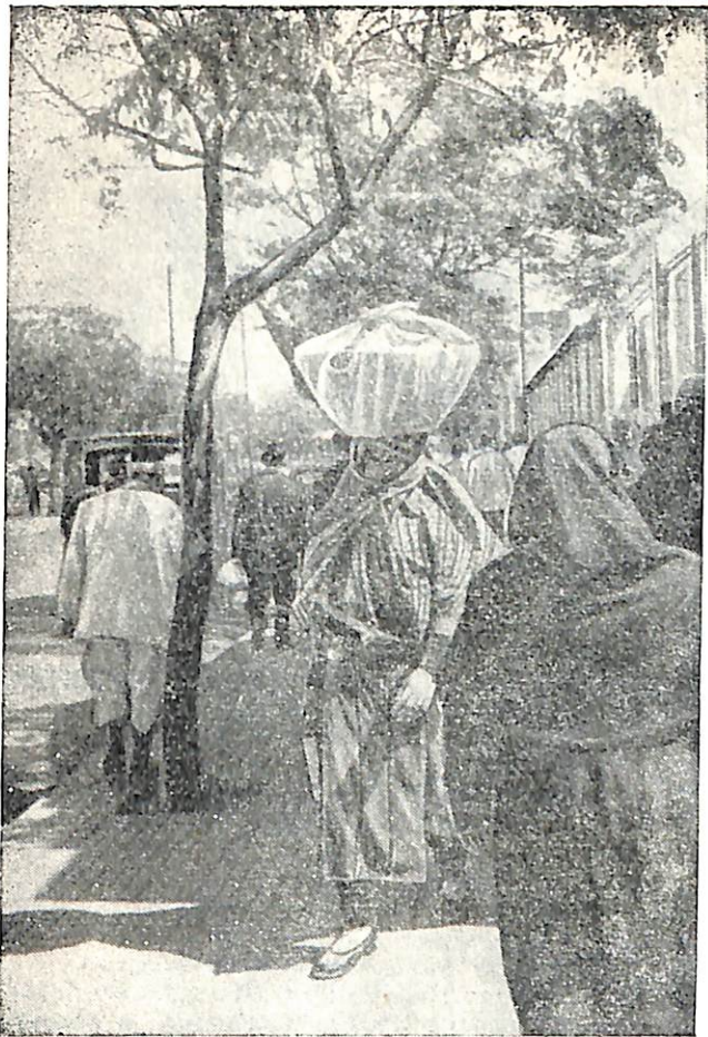
Дамаск. Возвращение с базара.

не глубока. Пусть ее везде можно перейти вброд. Но это река-труженик. Она орошает столько садов, виноградников, бахчей и огородов в пригородных районах Дамаска, что выращиваемых фруктов и овощей хватает не только для населения города, но некоторая их часть в натуральном или консервированном виде вывозится в другие районы и даже за границу. В черте города река одета в гранит, и по ее набережной любят прогуливаться жители Дамаска, особенно летом. Холодная вода, бегущая с гор, приносит приятную прохладу.